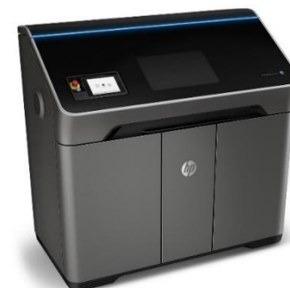
HP Jet Fusion 540 / 580