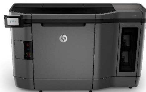
HP Jet Fusion 4200