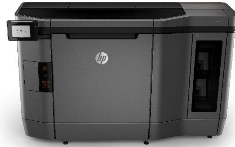
HP Jet Fusion 4200